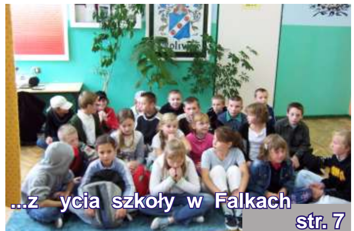
...z ycia szkoły w Falkach