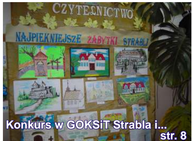
Konkurs w GOKSiT Strabla i...