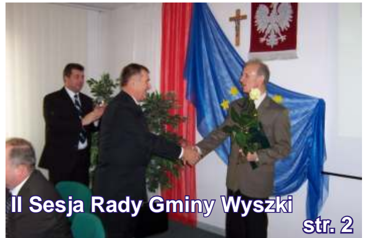
II Sesja Rady Gminy Wyszki