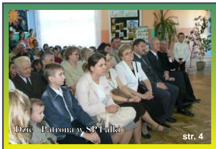
Dzie Patrona w SP Falki