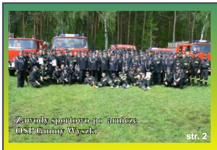
Zawody sportowo-po arnicze OSP Gminy Wyszki