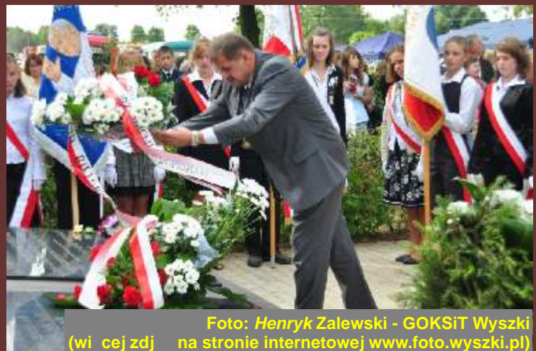
Foto: Henryk Zalewski - GOKSiT Wyszki (wi cej zdj na stronie internetowej www.foto.wyszki.pl )