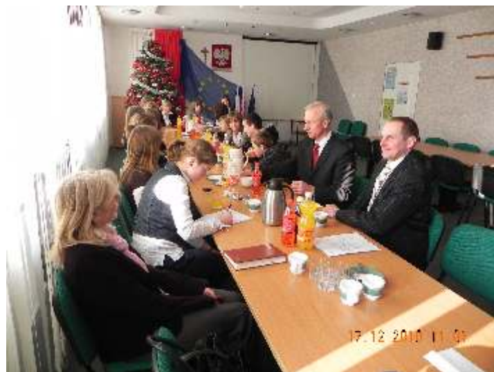
Foto: Sesja Młodzieżowej Rady Gminy, działającej przy Zespole Szkół w Wyszkach