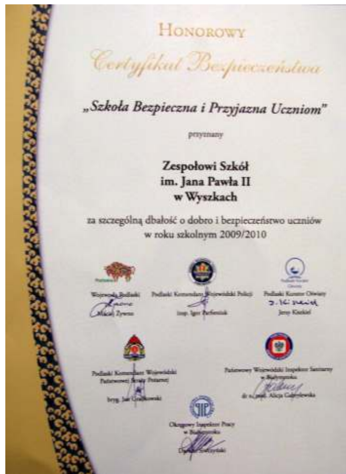
Foto: Certyfikat otrzymany przez Zespół Szkół w Wyszkach