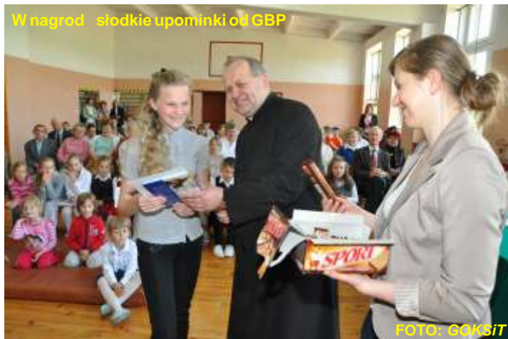
W nagrodę słodkie upominki od GBP

Do konkursu przystąpiło 21 uczniów Szkoły Podstawowej oraz 5 gimnazjalistów. Po burzliwej dyskusji Komisja wyłoniła zwycięzców, którzy otrzymali dyplomy i nagrody w postaci książek o tematyce religijnej.