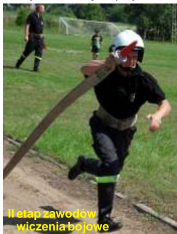
II etap zawodów wiczenia bojowe

Niedziela zapowiadała si bardzo upalnie. O godz. 9.00 w dniu 17 lipca 2011 roku w ko ciełe parafialnym w Strabli rozpocz ła si uroczysta Msza wi ta w intencji strażaków, po czym jednostki Ochotniczych Stra y Po arnych Gminy