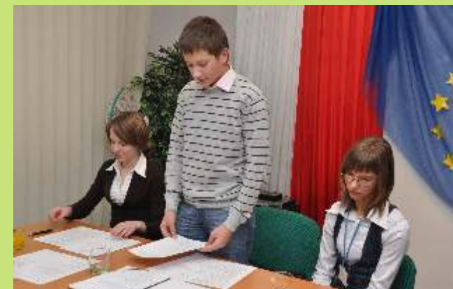
Prezydium MRG III kadencji