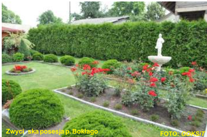
Zwyci ska posesja p. Bokłago