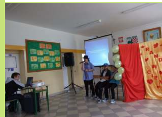
Randka w ciemno w wykonaniu MRG