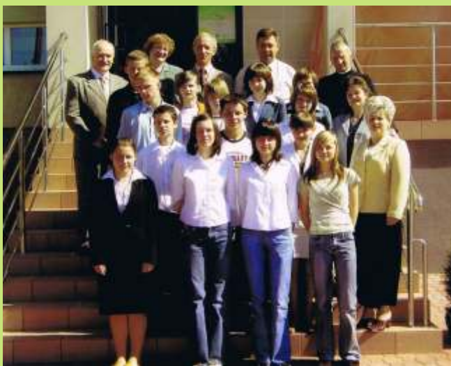
MRG II kadencji