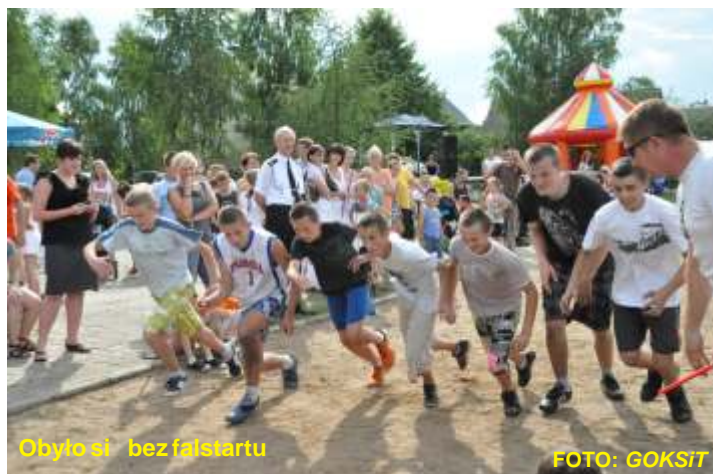
Obyło się bez fałstarcu