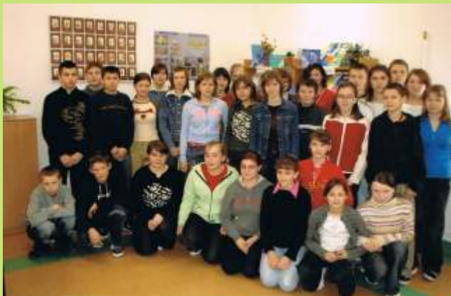
Kandydaci do MRG I kadencji

MŁODZIE GIMNAZJUM W WYSZKACH W LATACH 2004-2011 r.