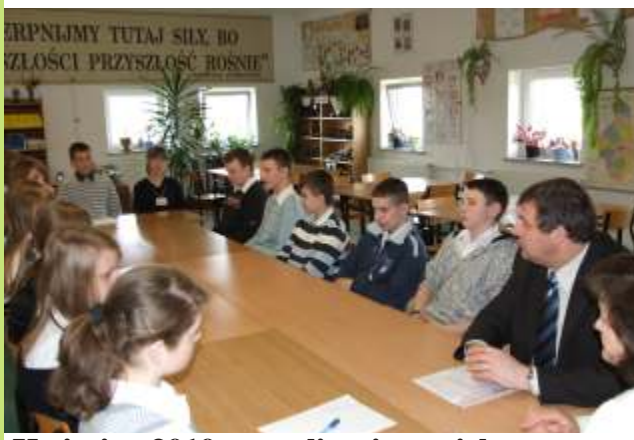
Kwiecie 2010 r.- realizacja projektu dotycz cego samorz dno ci uczniowskiej