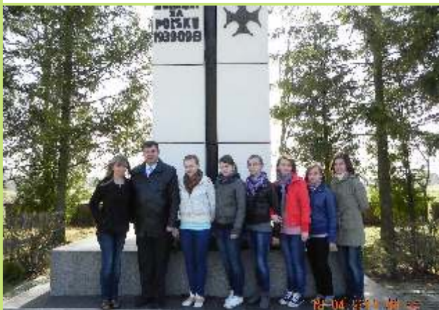
Wycieczka do Miejsc Pamięci Narodowej - Olszewo