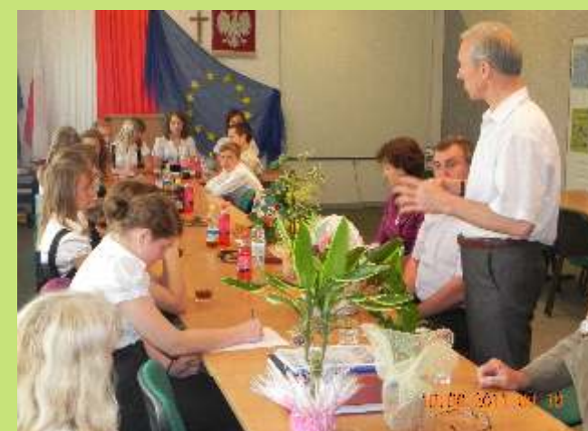
Sesja MRG IV kadencji- czerwiec 2011r.