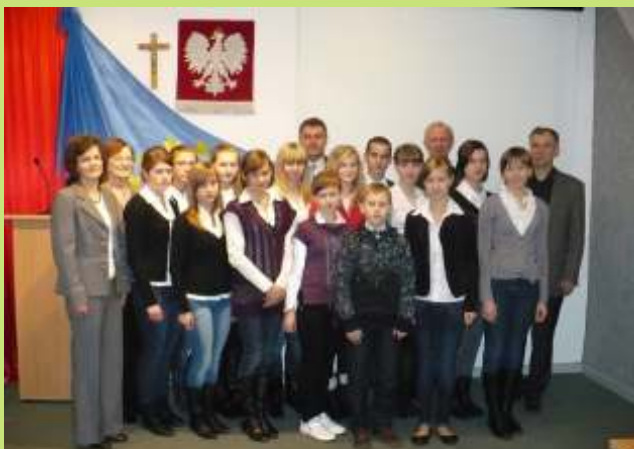
Sesja inauguracyjna MRG IV kadencji