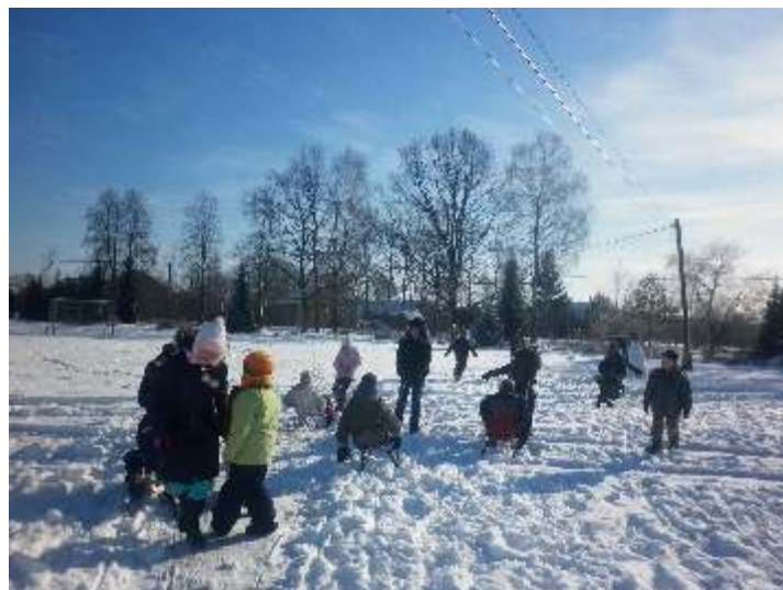
Rysunek: wesołe zabawy na boisku GOKSiT w Niewinie Borowym

Uczestnicy "Zimy w Mie cie" mieli yczenie skorzysta z pi knej zimowej aury w Niewinie. Dlatego te jeden dzie sp dzili my wspólnie na zimowym pikniku na placu szkolnym. Przez kilka godzin trwało wesołe zabawy na niegu, ognisko z kiełbaskami, pó niej gor ca herbata z p czkami i na koniec wesoła dyskoteka. Ostatni dzie ferii sp dzili my znowu w ODK na balu karnawałowym. Podsumowali my tam wspólnie sp dzone ferie, podzi kowali my za po yteczn zabaw oraz wr czyli my wszystkim drobne upominki.