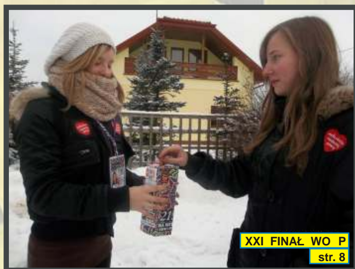
XXI FINAŁ WO P str. 8