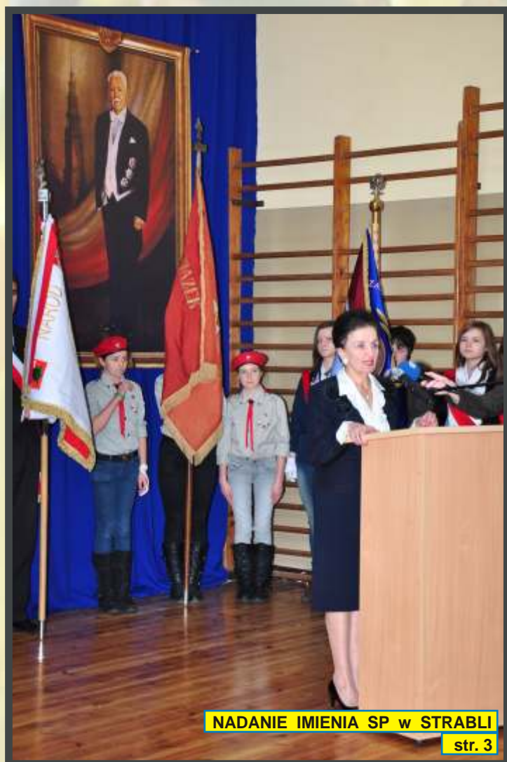
NADANIE IMIENIA SP w STRABLI str. 3