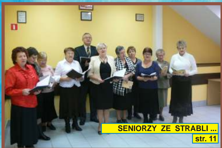
SENIORZY ZE STRABLI ... str. 11