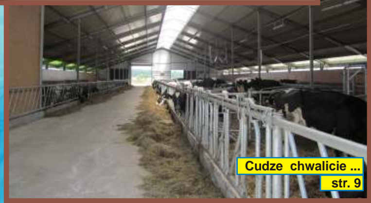
Cudze chwalicie ... str. 9