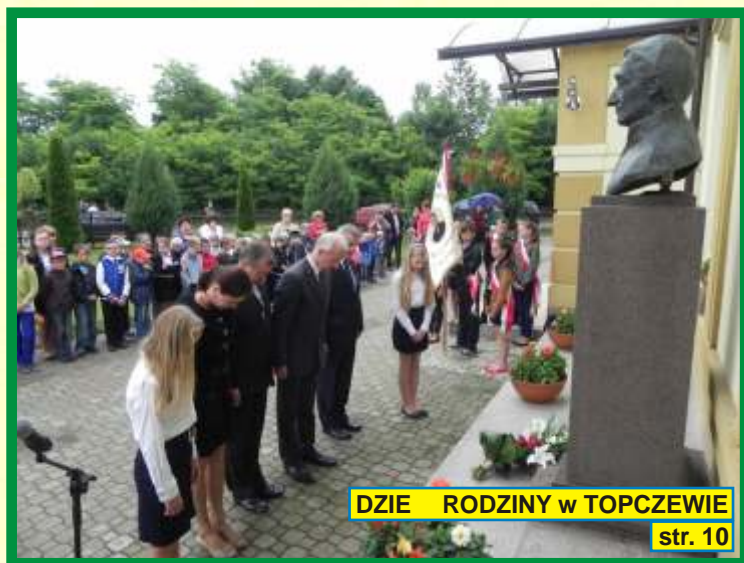
DZIE RODZINY w TOPCZEWIE str. 10