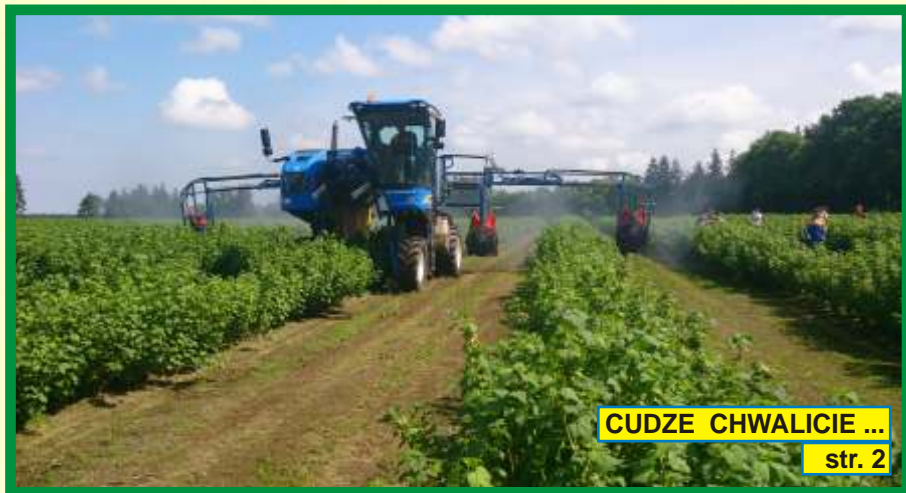
CUDZE CHWALICIE ... str. 2