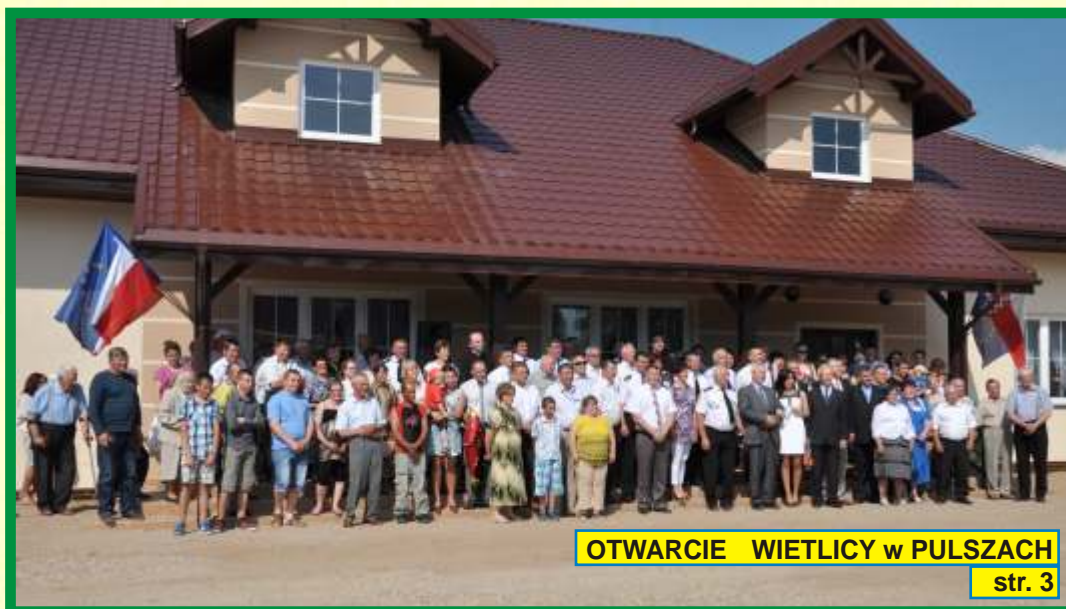
OTWARCIE WIETLICY w PULSZACH str. 3