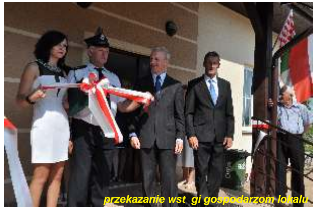
przekazanie kluczy gospodarzom lokalu